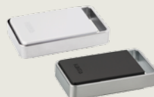
TouchGo Benutzermedium in Form eines Schlüsselanhängers