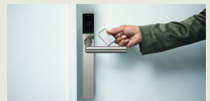
Einfache Programmierung über den Türdrücker