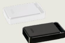
TouchGo Schlüsselanhänger mit TouchGo- und RFID-Funktion